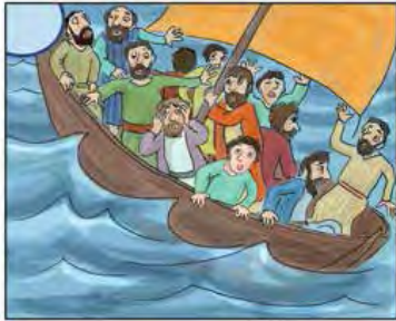
Eközben a tanítványok hajója hatalmas viharba került.

1. A képek Jézus tengeren járásának történetét mesélik el. Tedd sorrendbe az eseményeket, majd ragaszd be a melléklet matricáiból a hiányzó szereplőket!