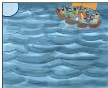
Már hajnalodott, amikor Jézus odament hozzájuk a tengeren járva. A tanítványok nagyon megrémültek, nem ismerték fel őt azonnal.

2. Egészítsd ki a mondatokat, majd írd le, ki mondta!