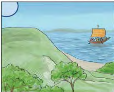
Ezután Jézus egyedül felment a hegyre imádkozni.